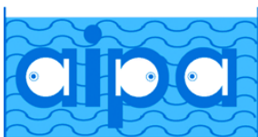
A.I.P.A. – Associazione Italiana Pesci ed Acquari